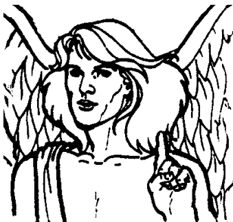
ARCÁNGEL SAN GABRIEL