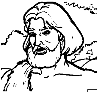
SAN JUAN BAUTISTA

Pon la letra de la frase en el cuadro de la persona correcta. Colorea