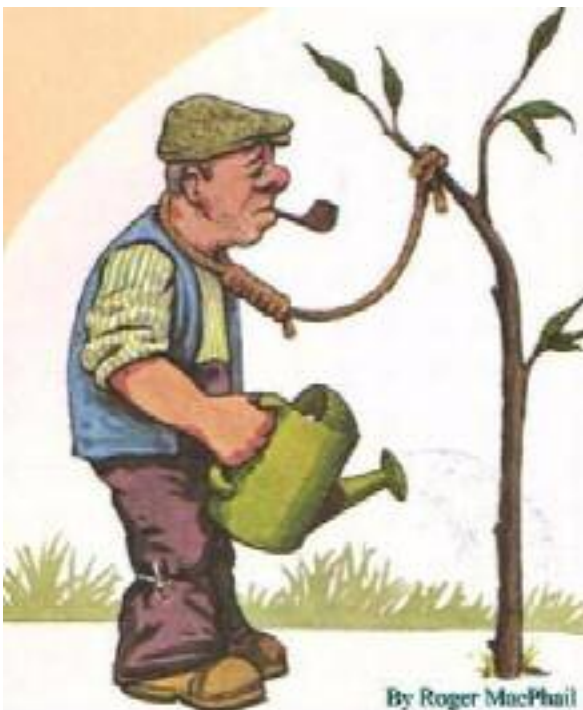
By Roger MacPhail

Entiende tú también a los demás. No abuses de la paciencia de otros, y cumple con tus obligaciones bien y puntualmente.